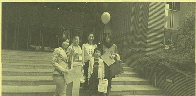
~昨年度 学園祭中の学内散策の様子 サンクンガーデン前&真宗総合学術センター「響流館」前~