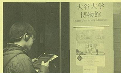
~昨年度の博物館見学の様子~