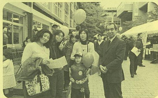
～昨年度 恩師との懇談風景～