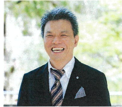
【講師プロフィール】